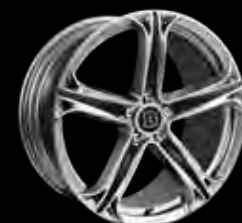
T BRABUS Monoblock T 20"