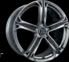
T BRABUS Monoblock T 22"