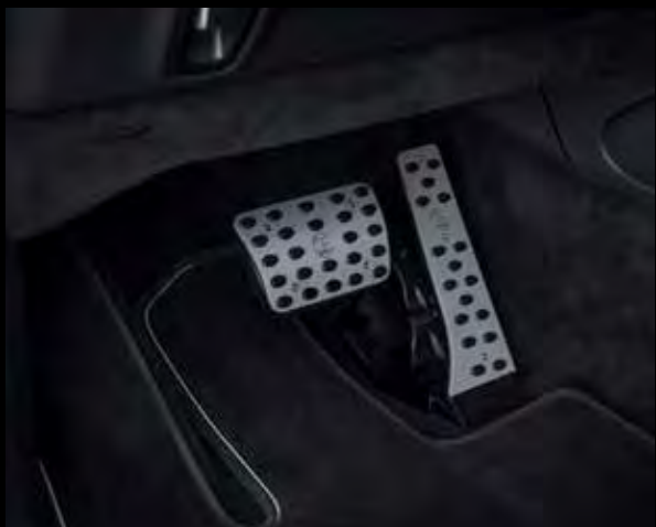
BRABUS Aluminium Pedalauflagen

BRABUS fine leather: Even unusual or outrageous leather colours are no problem. The BRABUS colour range is extensive and special requests for leather colours that match your favorite colour are a welcome challenge we'll gladly master. We place no limits on your imagination.