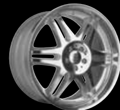
BRABUS Monoblock VI "PLATINUM EDITION" 21"