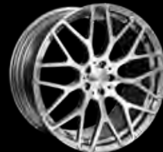
Y BRABUS Monoblock Y "PLATINUM EDITION" 21"/23"