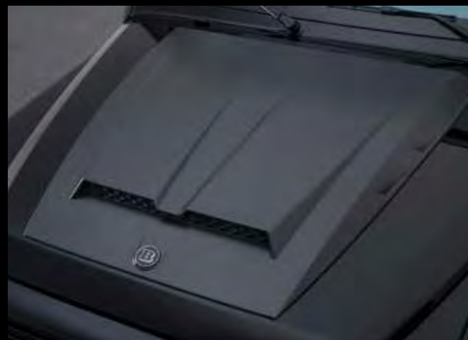
BRABUS Carbon Motorhaubenaufsatz, matt oder glänzend