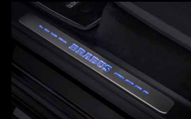
BRABUS Einstiegsleisten mit beleuchtetem BRABUS Schriftzug

BRABUS entrance panels with illuminated BRABUS logo