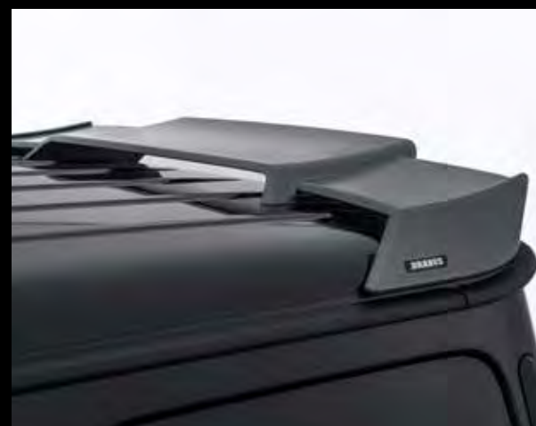
BRABUS Dachspoiler mit BRABUS Logo

BRABUS carbon roof add-on part, matt or glossy with LED high beam