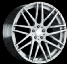
F BRABUS Monoblock F "PLATINUM EDITION" 21"