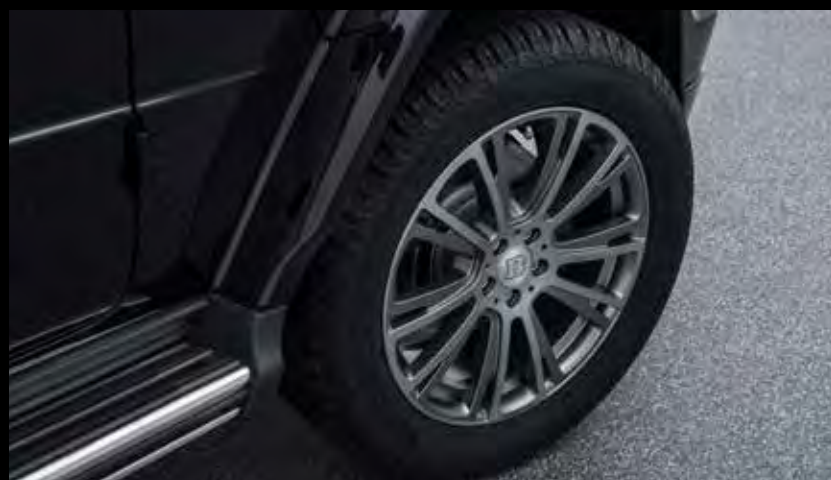
BRABUS Off Road Rad- und Reifenkombination BRABUS off road wheel and tire combination