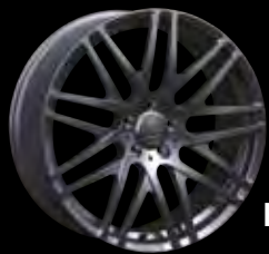
F BRABUS Monoblock F "PLATINUM EDITION" 23"