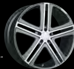
G BRABUS Monoblock G "PLATINUM EDITION" 22"