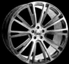
R BRABUS Monoblock R "PLATINUM EDITION" 21"/23"