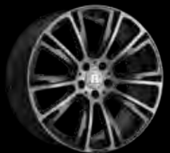
R BRABUS Monoblock R 20"/22"