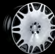
BRABUS Monoblock M "PLATINUM EDITION" 21"/23"