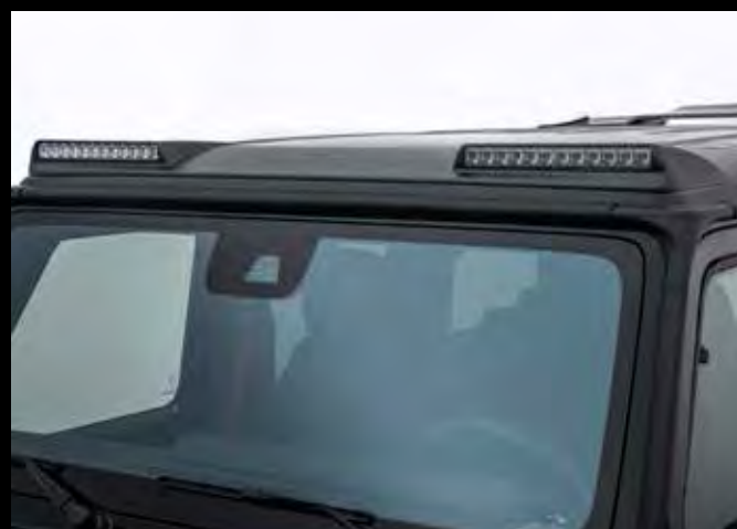
BRABUS BRABUS Carbon Dachaufsatz, matt oder glänzend mit LED Fernscheinwerfern

BRABUS carbon roof add-on part, matt or glossy with LED high beam