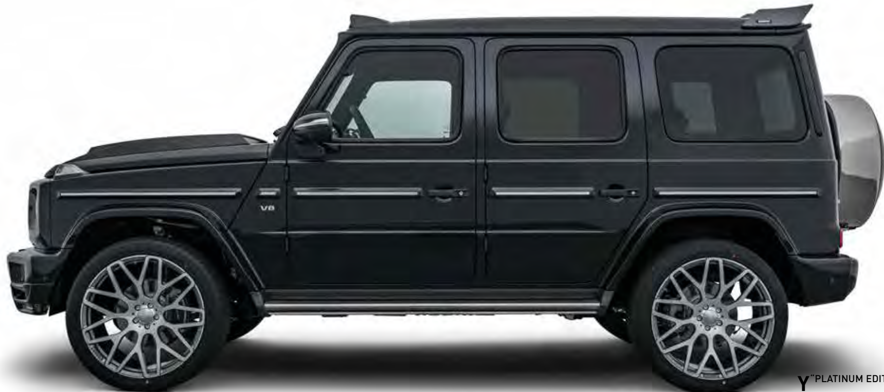
Y "PLATINUM EDITION"